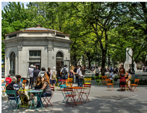
TABLE DE CONCERTATION DU QUARTIER DES GRANDS JARDINS